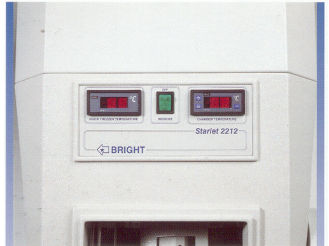
Panel de control

Placa estira cortes de fácil emplazamiento 2X Platinas porta muestras Bandeja desmontable Bandeja para desechos Herramienta para extraer la cuchilla Tapa Aislante Medio de inclusión de congelación Cryo-M-Bed Spray Cryospray