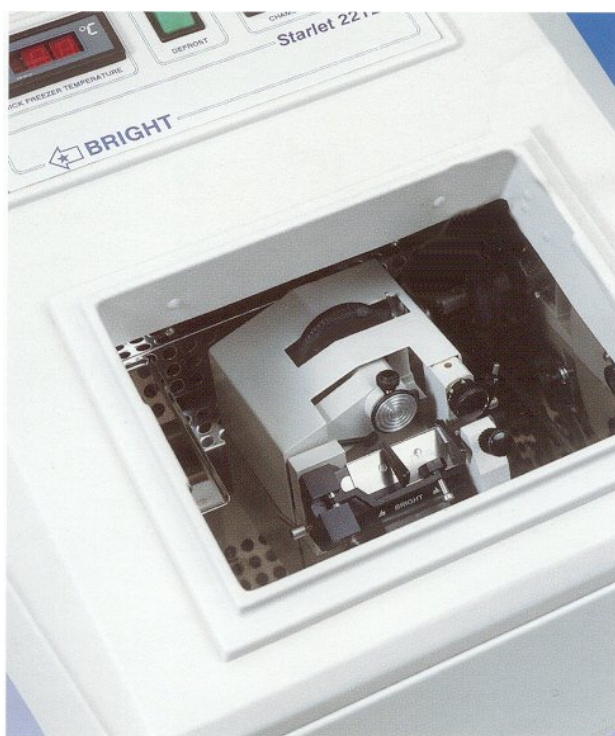
Versión del Starlet por palanca